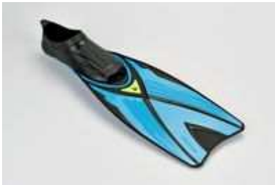
Grand Prix BLU