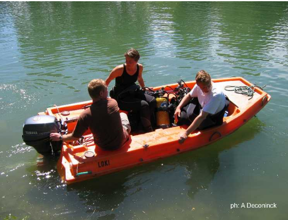
ph: A Deconinck